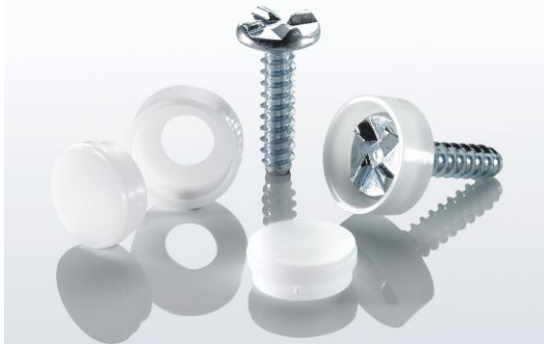
La fijación a prueba de manipulación se compone de tres partes: tornillo, arandela, sello.